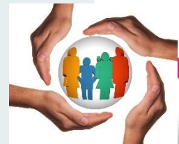
Gráfico 8: PRINCIPIOS DE LA PPSS

La garantía de la participación social respecto del derecho fundamental a la salud que se desarrolla mediante la PPSS se fundamenta en los siguientes principios: